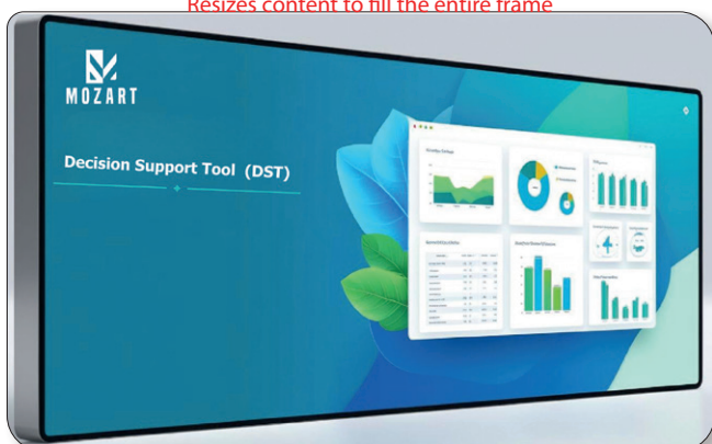
Fig. 1 - Strumento di Supporto alle decisioni di MOZART / Decision Support Tool of MOZART

Resizes content to fill the entire frame